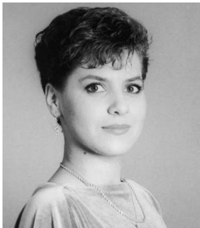
Dagmar Pecková v době svých prvních uměleckých úspěchů